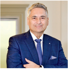
Guido Graf Regierungsrat, Vorsteher des Gesundheits- und Sozialdepartements des Kantons Luzern

Wir unterstützen das Projekt Neuweg 3 des Vereins Jobdach aus folgenden Gründen: